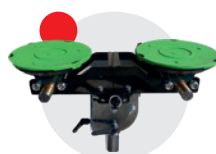
Ventose per vetri fino a 180 kg